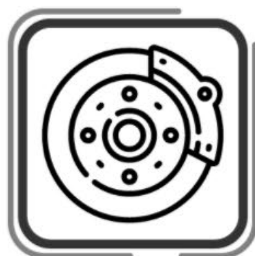
Ajustes de frenos (no aplica en el primer servicio)