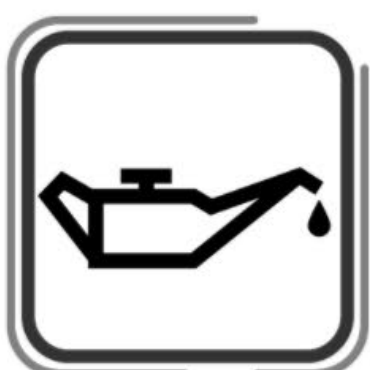
Revisión y limpieza del cedazo del aceite