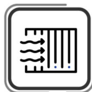
Revisión y limpieza del filtro de aire