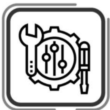
Apriete de tornillería (eje delantero y trasero, bases de amortiguadores, manubrios, barras de suspensión, soporte de motor y horquillas.