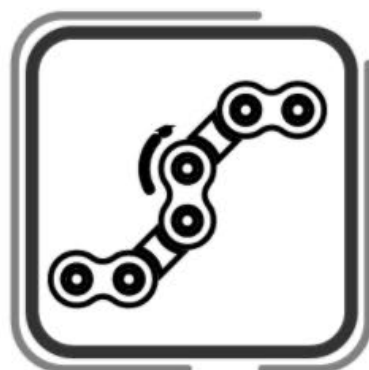
Ajuste y lubricación de cadenas ( en los modelos que aplique