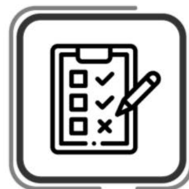
Revisión de punterías (ajuste cuando proceda)