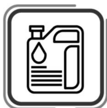
Cambio de aceite de motor