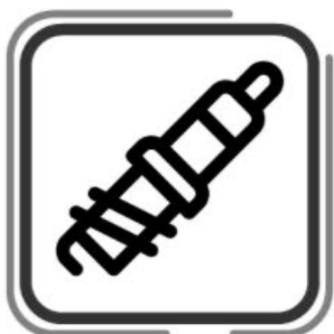
Cambio de bujía (no aplica en el primer servicio)