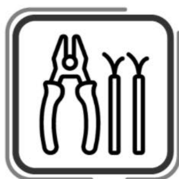
Lubricación y ajuste de chicotes